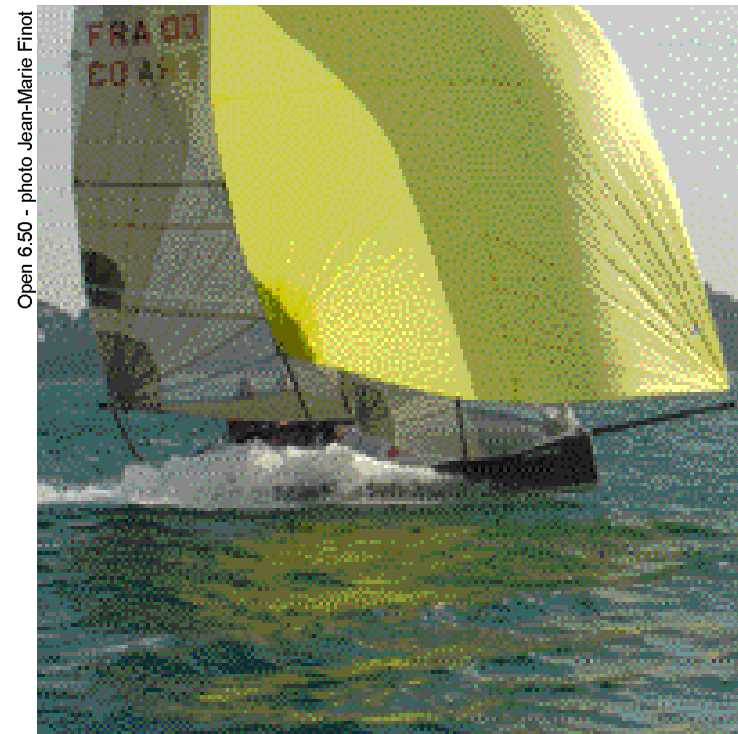
Open 6.50

40' Spirit of Yukoh, Kojiro Shiraishi, ex Baronesa, 3eme Around Alone 2002-2003( classé avec les 50'), 1er des 40'.